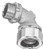
MAS 90°アングルコネクタ MAS-AG MAS-AC