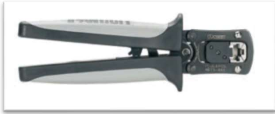
カテゴリ-5e RJ45シールドプラグ